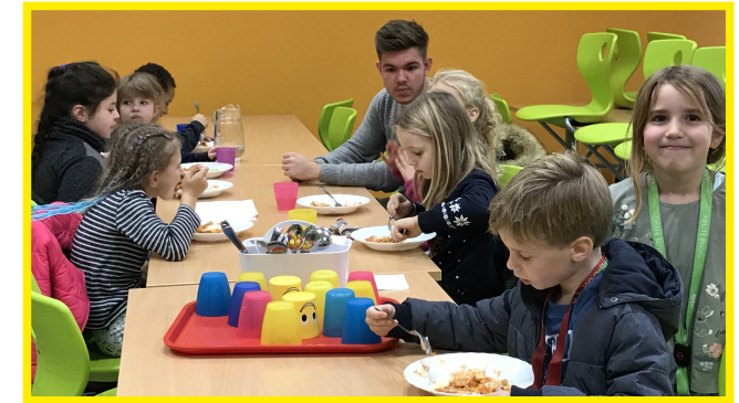
Mittagessen in den Räumen des Schülercafés von 12:30-13:30 Uhr

Mit dem Kochhaus Oskar aus Forstern konnten wir einen kompetenten Partner gewinnen, der mit Zutaten aus der Region täglich frisch kocht und das Essen heiß anliefert ( www.kochhaus-oskar.de ).