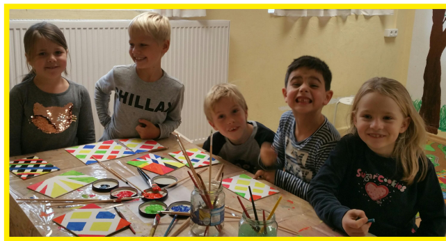
Kreatives Arbeiten und Gestalten